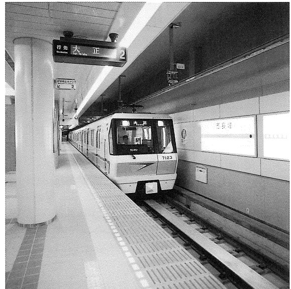
■地下鉄7号線西長堀停留場および地下線路工事

大阪市地下鉄7号線は、平成9年8月に延伸工事が完成し全線開通した。以来2年目をむかえ、大阪市域の東西を結ぶ3番目の路線としてすっかり市民の足として定着しつつある。本事業は、このうち開削工法による西長堀停留場の構築と、気泡土圧シールドによる西長堀停留場～大阪ドーム前千代崎停留場間の延長約900mの単線並