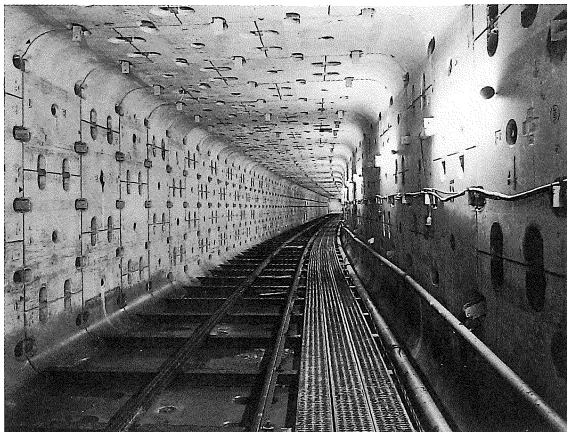
■高速鉄道東西線二条城前駅出入口(2)建設工事

京都市交通局 中央復建コンサルタンツ(株) 株式会社 銭高組大阪支社 矢作建設工業(株)大阪支店 ケイコン株式会社