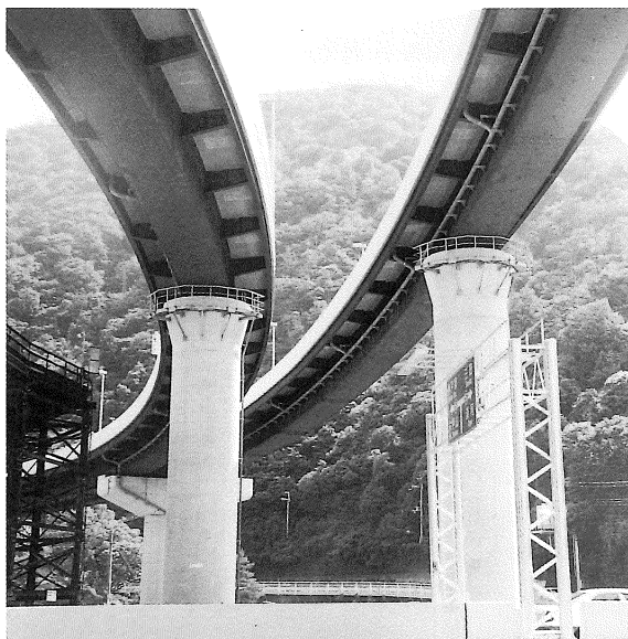
■阪神高速道路における無塗装耐候性鋼材の適用

北神戸線での無塗装耐候性橋梁の本格採用は、建設初期投資や塗装塗替費の削減等、コスト縮減に大いに貢献している。