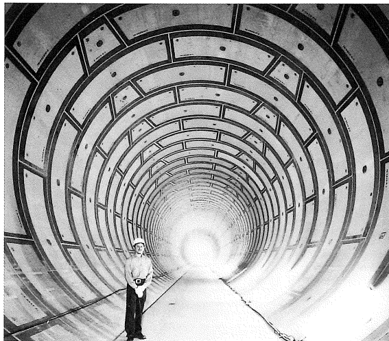
■寝屋川北部地下河川事業 ～日本初の一次履行のみによる内圧対応型トンネルの築造～

地下河川は全体完成を待たずに、完成区間から順次、貯留池として供用していく予定である。